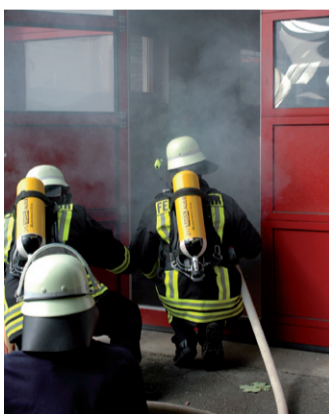
Atemschutzübung mit Personenrettung am Feuerwehrhaus Oberstreit.

Gemäß unserem Wappen bestehen unsere Aufgaben aus Retten, Bergen, Löschen und Schützen und zwar innerhalb von 8 Minuten nach der Alarmierung. In den letzten Jahren wurden wir zur Bekämpfung eines Flächen- und Fahrzeugbrandes, zur technischen Unfallhilfe und ganz aktuell zur Sicherung im Zusammenhang mit einem sehr gefährlichen Gefahrstoffunfall in unserem Ort gerufen. Allerdings sind wir tagsüber aufgrund der eigenen Berufstätigkeit meistens nur mit 2 oder 3 Feuerwehrleuten vor Ort. Aus diesem Grund wurden Ausrückgemeinschaften mit den Nachbarwehren eingeführt, was uns zusätzlich noch zur Mithilfe bei Einsätzen dieser Wehren verpflichtet.